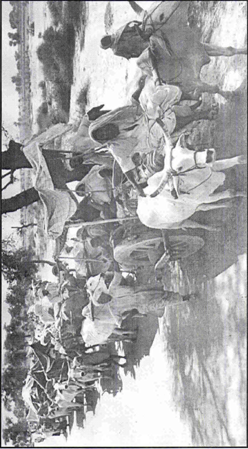
विस्थापितों का काफ़िला